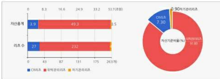
운용부동산 유형별 리츠 수 및 자산총계