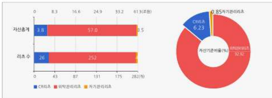
운용부동산유형별 리츠 수 및 자산총계

* 기준일 현재 20년 부동산투자회사법상 공모한 리츠 - 13개 기준일 현재 부동산투자회사법상 공모 채정된 리츠 - 14개