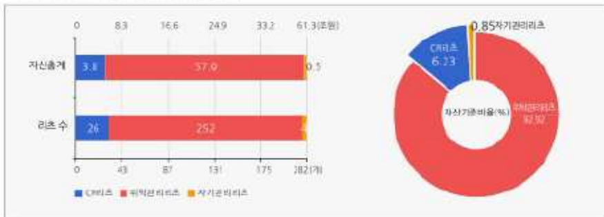
운용부동산 유형별 리츠 수 및 자산총계

* 기준일 현재 20년 부동산투자회사법상 공유했던 리츠 13개 기준일 현재 부동산투자회사법상 공조 예정인 리츠 18개